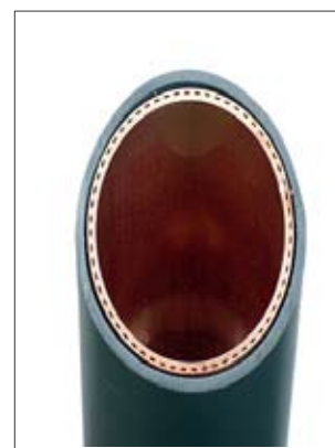
Doorsnede douche WTW

De BRIES douche WTW voldoet aan de door TNO gestelde eisen met betrekking tot legionella. Er zijn in het geheel geen dode ruimten, de inhoud bedraagt 0,3 liter, er is een turbulente doorstroming en de douche-WTW mag niet geïsoleerd worden.